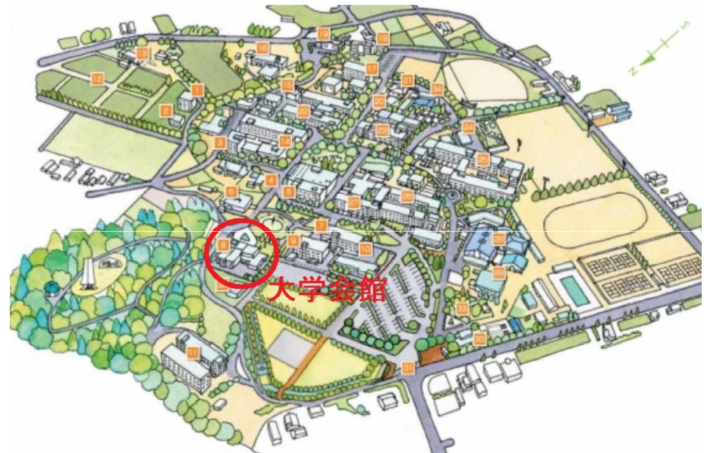
—— 山口大学吉田キャンパス ——